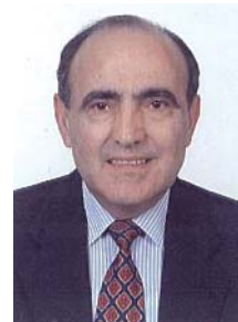
Por MIGUEL ÁNGEL GONZÁLEZ Magistrado del Juzgado de lo Social n.º 13 de Valencia

produciendo efectos perturbadores en la marcha de los procesos por el abuso de su utilización. Los cambios producidos fueron importantes, pues aunque el punto 3 resaltaba que "No se admitirá con carácter general el incidente de nulidad de actuaciones", y que "el juzgado o tribunal inadmitirá a trámite cualquier incidente en el que se pretenda suscitar otras cuestiones", se abre la posibilidad de un incidente excepcional, que se justificaba en la Exposición de Motivos de la Ley en la indeseable situación resultante del tenor literal del artículo 240.2, que niega cauce procesal para declarar la nulidad radical de actuaciones por vicio procesal, una vez que hubiera recaído sentencia definitiva, produciendo inconvenientes graves para los justiciables y para el Tribunal Constitucional.