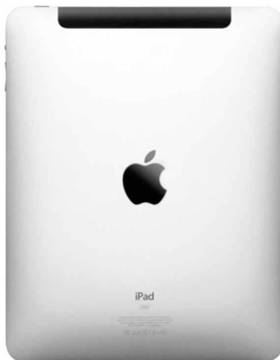
iPad (Wi-fi + 3G 16GB)